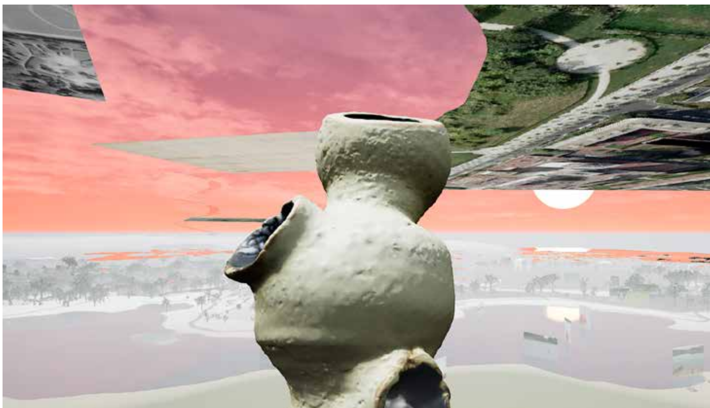
NIVEAUX DE DÉTAIL 2022 (travail en cours)