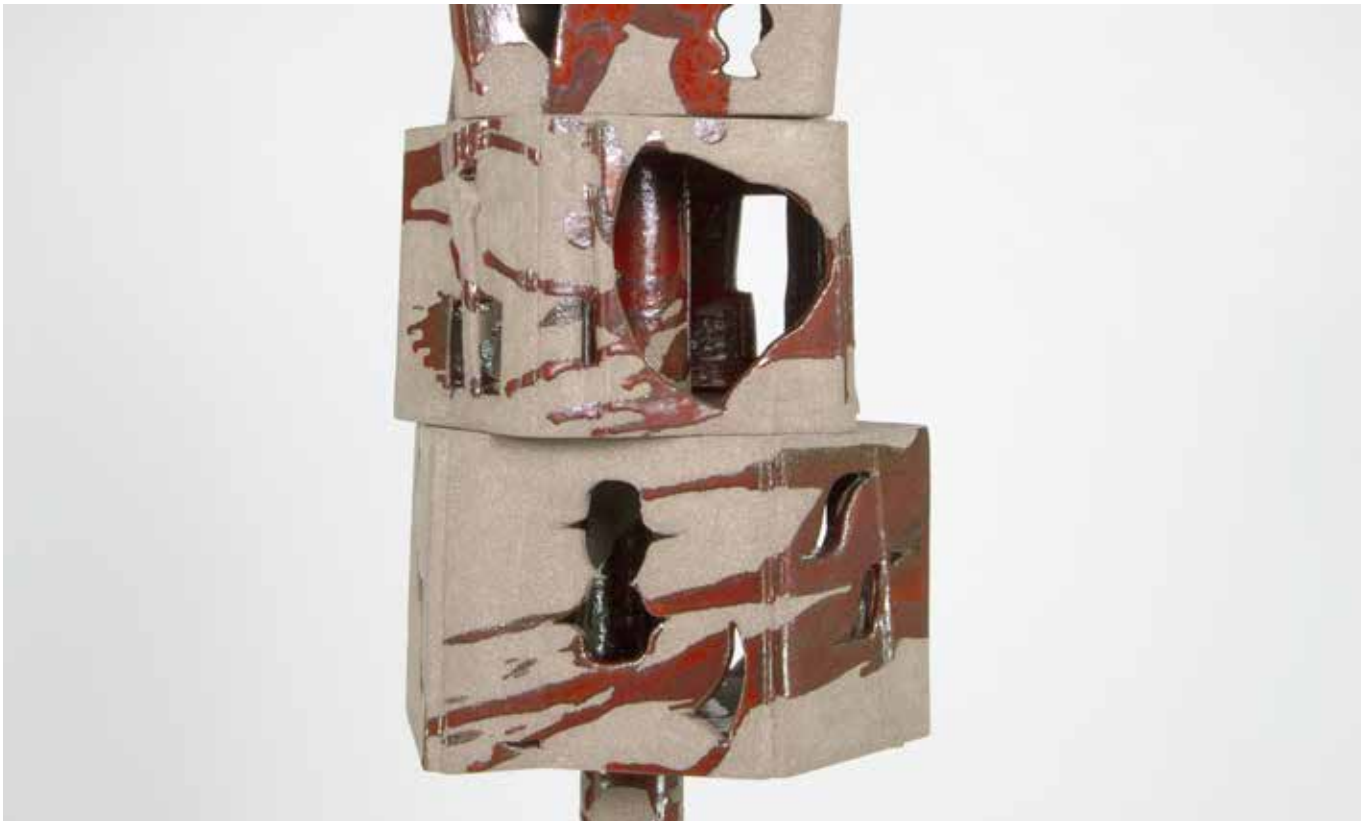
DIFFRACTION (DÉTAIL) 2022