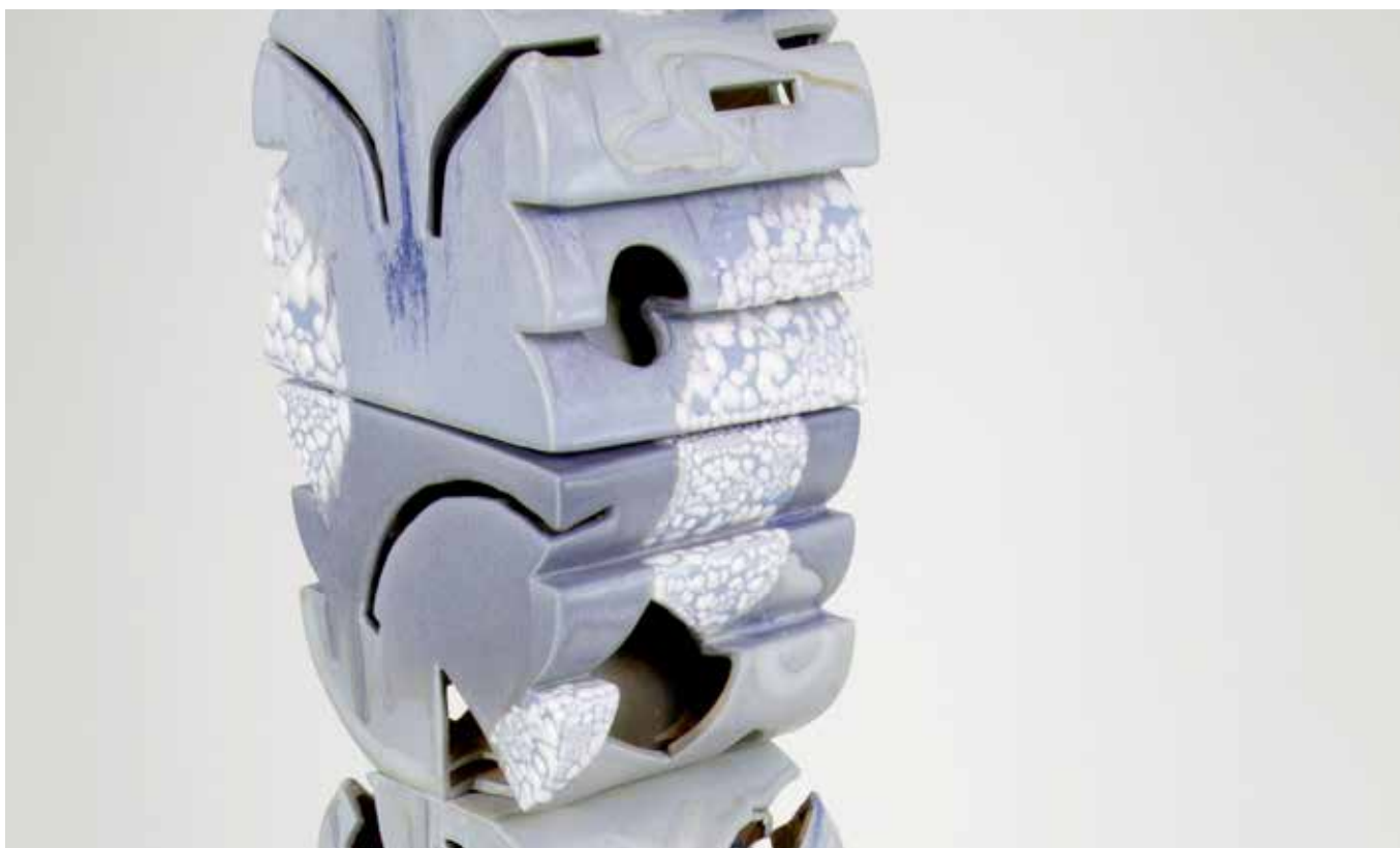
LE TEMPS INCERTAIN (DÉTAIL) 2022